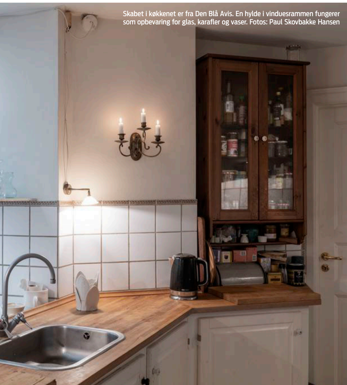
Skabet i køkkenet er fra Den Blå Avis. En hylde i vinduesrammen fungerer som opbevaring for glas, karafler og vaser.