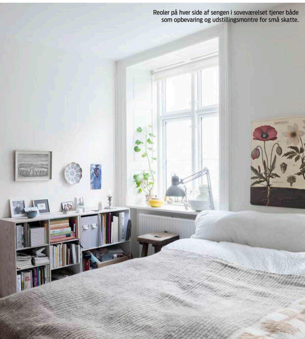
Reoler på hver side af sengen i soveværelset tjener både som opbevaring og udstillingsmontere for små skatte.