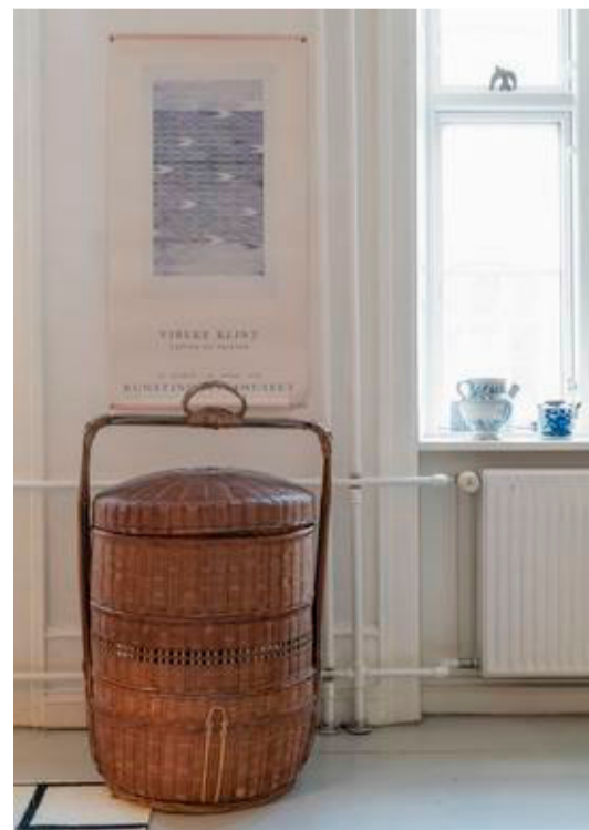
Den gamle kurv fra Thailand bruger Le Klint til syting. På væggen hænger en plakat fra en udstilling om Vibeke Klint på Kunstindustrimuseet. Keramikken i vindueskarmen er fra hendes barndomshjem.