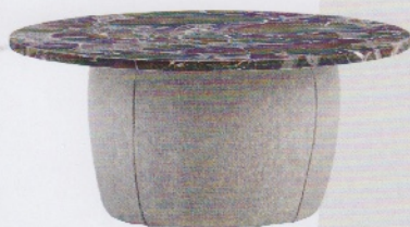
Cirkus Table med plade i sten og base i tekstil, fra 9.182 kr. (Eilersen).

Kontraster mødes i værket CC bestående af en solid betonklods, hvorfra et vildt stykke metalnet synes at være ved at flyve væk. Den australske kunstner Andy Boots værker har noget monumentalt over sig, som også ses i dette værk, hvor piedestalen er en integreret del af værket (Andy Boot).