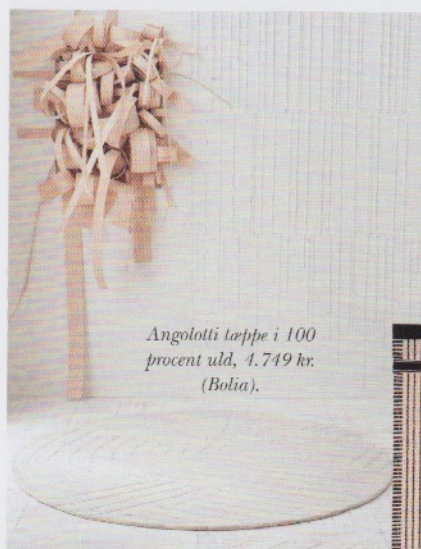
Angolotti tæppe i 100 procent uld, 4.749 kr. (Bolia).