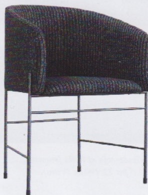
Covent stol i klassisk sribet Bowery uld fra New Works, fra 6.235 kr. (Artilleriet).