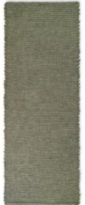
Blød gulvløber, som er håndlavet i Portugal og produceret af genbrugsfibre og overskud fra tekstilindustrien. Fås i flere farver og kan vaskes på 30 grader. Hazelnut-løber, Elvang, 60 x 180 cm, 949 kr. elvangdenmark.dk