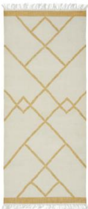
Tæppe i newzealandsk uld håndknyttet af Linie Designs egne vævere. Med diagonale striber, der skaber såvel ro som opmærksomhed – fås i flere farver. Smilla Runner, Linie Design, 80 x 180 cm, 2500 kr. liniedesign.com