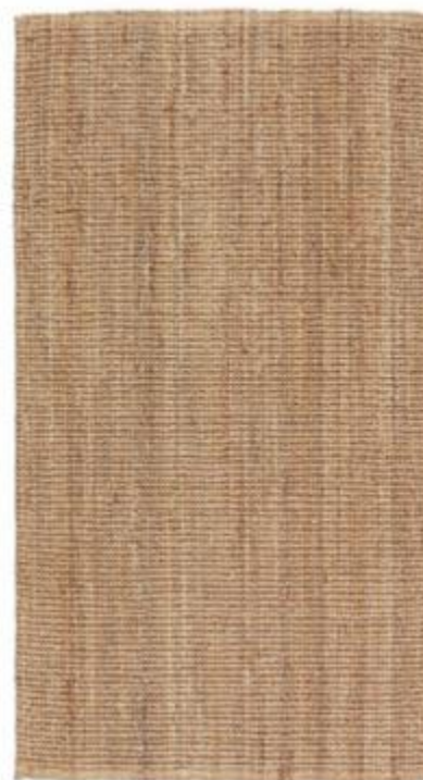
Noget nær den perfekte lille løber til køkkenet eller en entré – vævet af jute, der er slidstærkt, og som holder form og farve i mange år. Lohals, Ikea, 80 x 150 cm, 199 kr. ikea.com