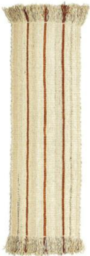
Smuk løber af tyk, blød fåreuld håndvævet af beduinkvinder i Negev-ørkenen i Israel. Fås i flere størrelser og udtryk. Esther Rust Runner, Kusiner, 80 x 280 cm, 14.000 kr. kusiner.dk