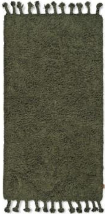
Træd ud på blød, tuftet bomuld frem for et koldt gulv. De tykke, flettede frynser understreger det håndgjorte udtryk. Fås også i en lys brunlig nuance. Amass Long Pile Runner, Ferm Living, 70 x 140 cm, 899 kr. fermliving.dk