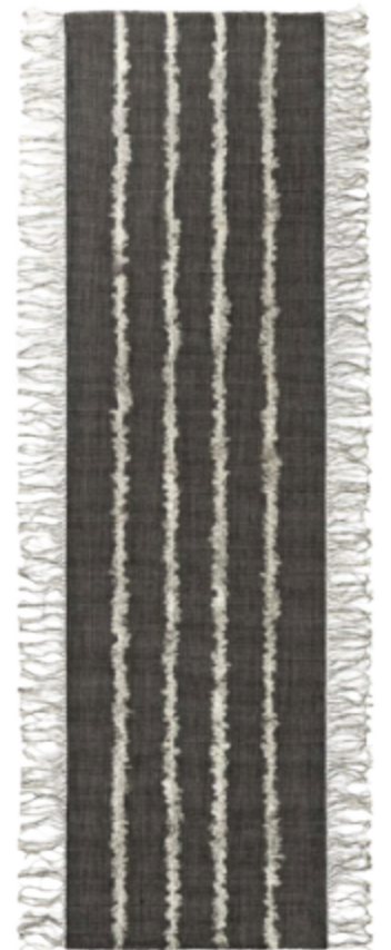
Elegant løber af uld med striber af naturlig fåreuld, der skaber en særlig taktilitet og et blødt udtryk. Rug Flannel Pepper, Svenskt Tenn, 300 x 80 cm, 11.991 kr. svensktenn.se