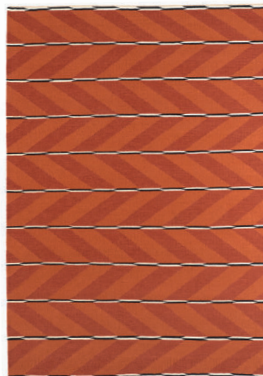
Tæppe VK-6 Rød Orange Fås også som løber