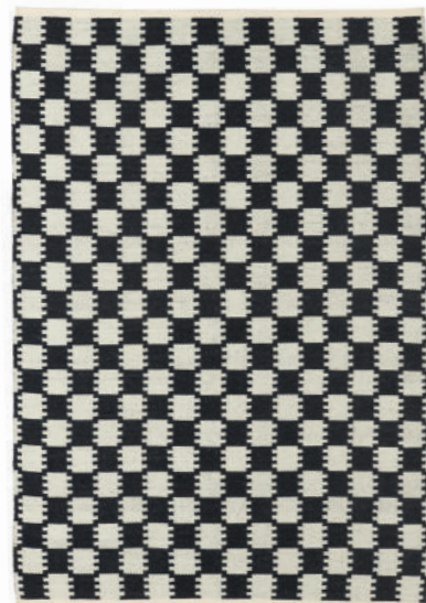
Tæppe VK-5 Sort Hvid Fås også som løber