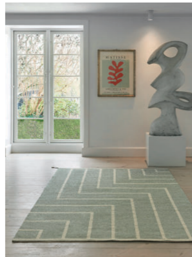
Traditionelt landsted, Ålsgårde