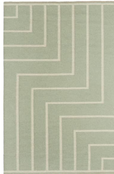
Tæppe VK-1 Oliven Hvid