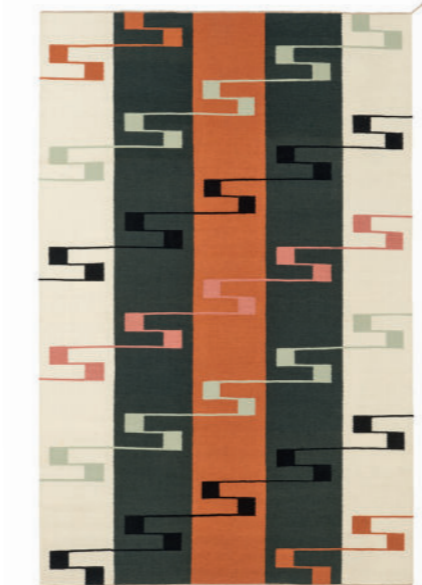
Tæppe VK-8 Skifer Hvid Orange