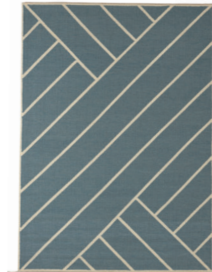
Tæppe VK-2 Lys blå Hvid