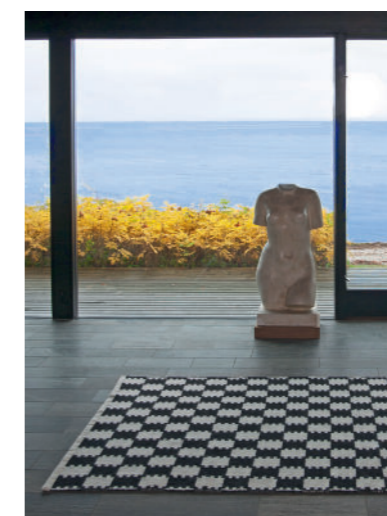
Arkitekt Halldor Gunnløgssons bus, Rungsted