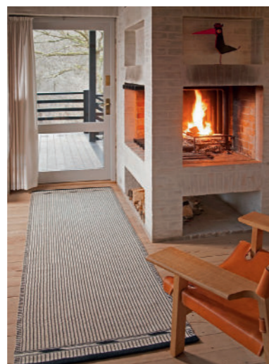
Arkitekt Børge Mogensens bus, Gentofte