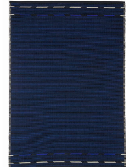
Tæppe VK-4 Blå Fås også som løber